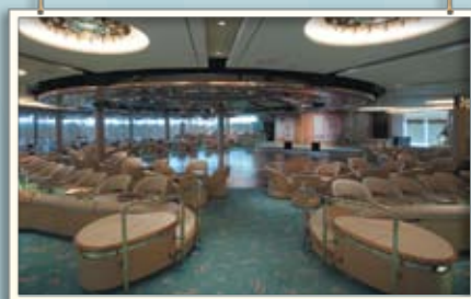
Some Enchanted Evening Lounge